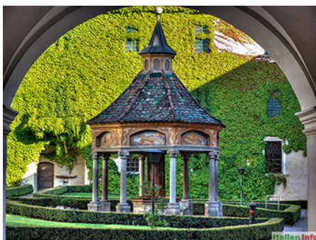
Brunnenhaus im Kloster Neustift